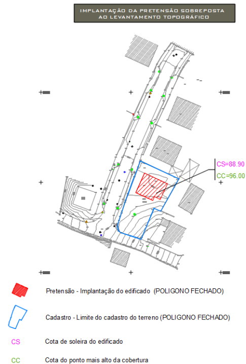
Fig.2 – Planta de Implantação da Pretensão